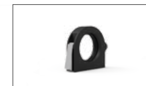
ATTACCO CON CHIUSURA METALLICA RINFORZATA