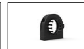
ATTACCO STANDARD CON PETTINI FISSACAVO