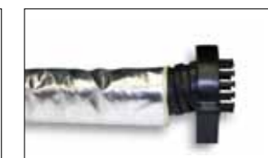
GIACCA DI PROTEZIONE