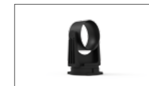
ATTACCO CON ANELLO DI SCORRIMENTO, OSCILLANTE E FLANGIA GIREVOLE