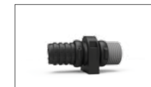
RACCORDO DI GIUNZIONE TRA MULTIFLEX E GUAINA