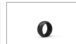
PARACOLPI / PROTEZIONE