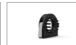
ATTACCO CON CHIUSURA METALLICA CON PETTINI FISSACAVO