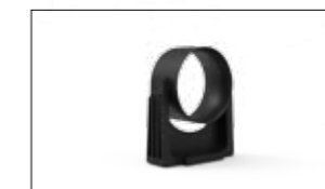
ATTACCO CON ANELLO DI SCORRIMENTO, OSCILLANTE