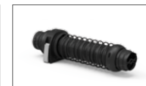
VARI DISPOSITIVI CON MOLLA DI RICHIAMO