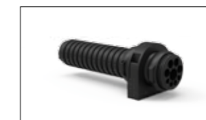
RACCORDO DI GIUNZIONE CON ORGANIZZAZIONE E BLOCCO CAVI