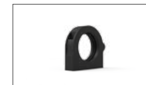
ATTACCO STANDARD SENZA PETTINI FISSACAVO