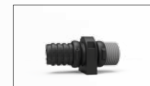
RACCORDO DI GIUNZIONE TRA MULTIFLEX E GUAINA