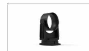
ATTACCO CON ANELLO DI SCORRIMENTO, OSCILLANTE E FLANGIA GIREVOLE