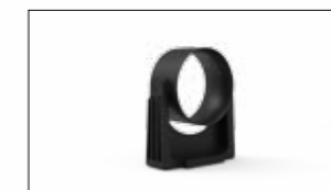
ATTACCO CON ANELLO DI SCORRIMENTO, OSCILLANTE