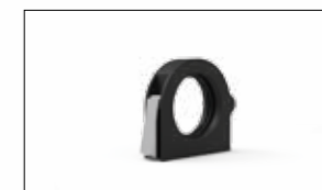
ATTACCO CON CHIUSURA METALLICA RINFORZATA