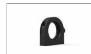
ATTACCO STANDARD SENZA PETTINI FISSACAVO