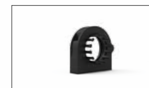
ATTACCO STANDARD CON PETTINI FISSACAVO